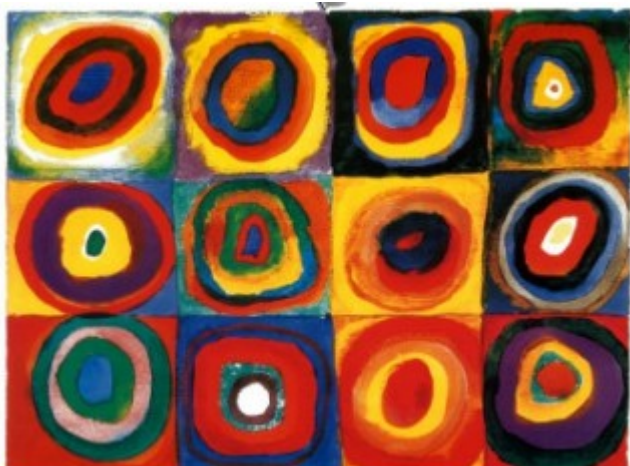
Vassily Kandinsky, 1911 Musique zen et art abstrait

L'art abstrait se divise par la suite en deux courants principaux, celui de l'abstraction géométrique et celui de l'art lyrique. Vassily Kandinsky, Piet Mondrian, Auguste Herbin sont des artistes importants de l'abstraction géométrique.