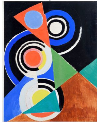
Delaunay, Composition pour jazz