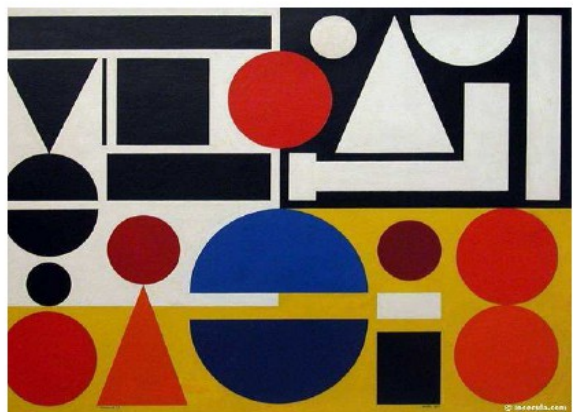
Vendredi d'Auguste Herbin, 1951 huile sur toile, 0.96 m sur 1.3 m Centre Georges Pompidou

L'art abstrait est né entre 1910 et 1920. Ses formes ne représentent jamais les choses existantes telles qu'elles sont dans la réalité, il s'agit au contraire d'un nouveau langage qui dira, non plus le monde, mais le fond de l'être et de la vie. "La peinture abstraite commence aux limites du silence [...] du langage et de la musique", Kandinsky, en 1915.