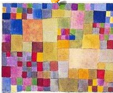
Paul Klee, 1922 Senecio