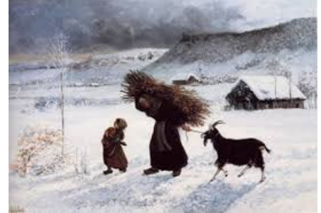
La pauvre du village, tableau de Gustave Courbet, 1866