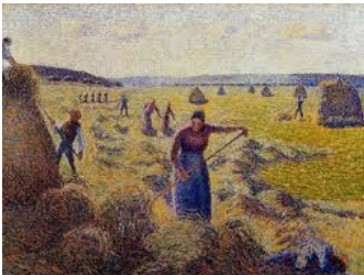
La récolte des foins à Eragny, Camille Pissarro, 1887