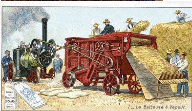
Publicité pour la batteuse à vapeur, vers 1910