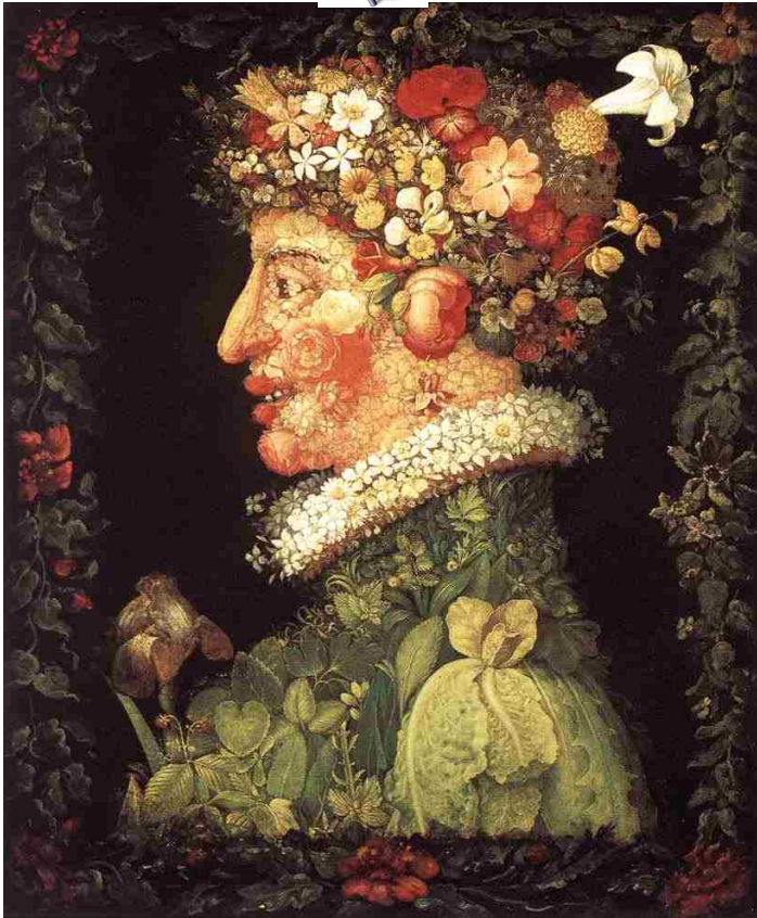
Date de réalisation 1573 Dimensions 76 cm x 63 cm

Nom Arcimboldo Époque 1527 - 1593 Nationalité Italienne Profession Peintre